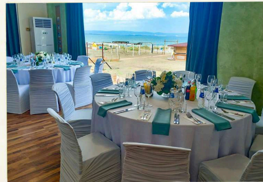
Зала Ла Виста